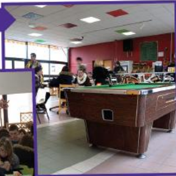
La maison des lycéens

Le lycée accompagne chaque lycéen dans son parcours scolaire par l'usage des langues vivantes, des nouvelles technologies et l'accès à la culture. Il responsabilise également les lycéens par la mise en place du Budget Participatif des Lycées et la gestion de la maison des lycéens.